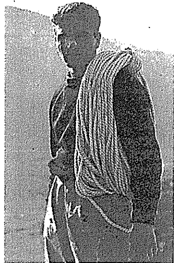
L'alpinista Cesare Maestri